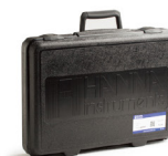
HI721006 HI96 系列专用便携箱