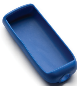
HI710029 蓝色防震防滑保护护套