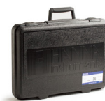
HI721006 HI96 系列专用便携箱