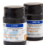
CAL Check 核查标定组