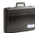
HI721006 HI96 系列专用便携箱